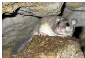
Le Loir gris