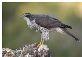
L'Autour des palombes