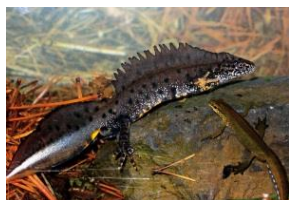
Le Triton crêté