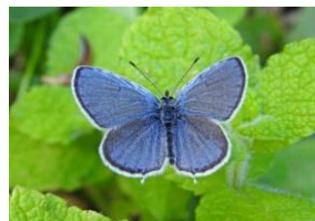
L'Azuré de la Faucille