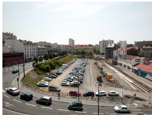
Rue de la Montat