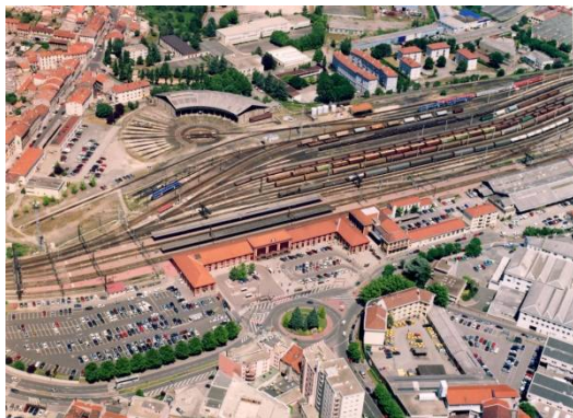
Gare et faisceau ferré