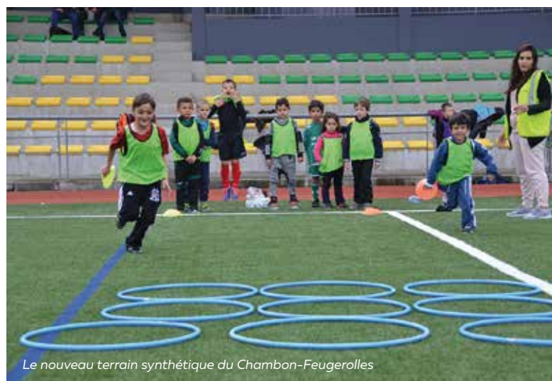
Le nouveau terrain synthétique du Chambon-Feugerolles

Cellieu / Fraisses / Le Chambon-Feugerolles / L'Étrat / La Tour-en-Jarez / Saint-Priest-en-Jarez / Saint-Héand / Saint-Étienne / Rive-de-Gier / La Fouillouse / Roche-la-Molière / Saint-Genest-Lerpt / La Grand-Croix / Lorette / Firminy / Saint-Christo-en-Jarez / Marcenod / Vafleury / Saint-Romain-en-Jarez / Saint-Étienne / Saint-Victor-sur-Loire / Andrézieux-Bouthéon / Génillac / Saint-Martin-la-Plaine / Saint-Joseph.