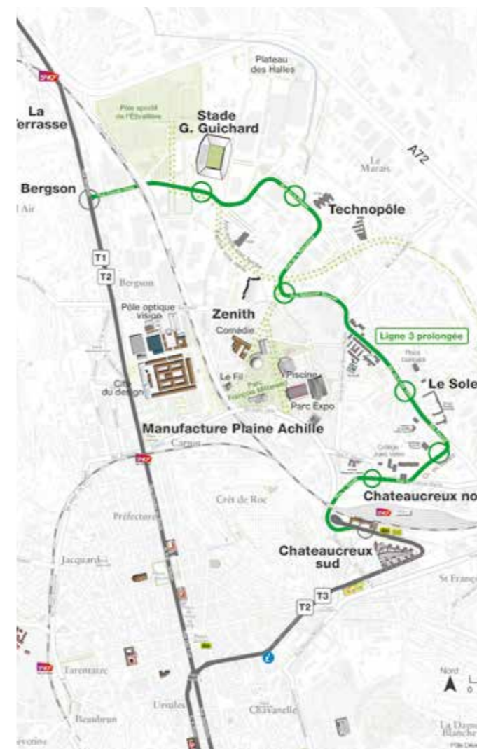
Le tracé de la 3 e ligne de tramway

250 € d'éco subvention versé à 240 acquéreurs de Vélo à Assistance Électrique (soit 60 000€ d'éco-subvention)