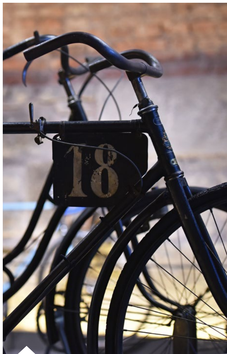
© Saint-Étienne Métropole / Charlotte PIEROT Salle d'exposition du Musée d'Art et d'Industrie Direction de la Communication VSE - SEM.

Parmi les entreprises les plus connues figurent Stronglight, spécialiste mondial du pédalier et des plateaux, Tonic Cycle, fabricant de cadres ou encore Cycles Mercier - France Loire, qui monte et équipe des bicyclettes, dont les fameux Vélo'V de Lyon.