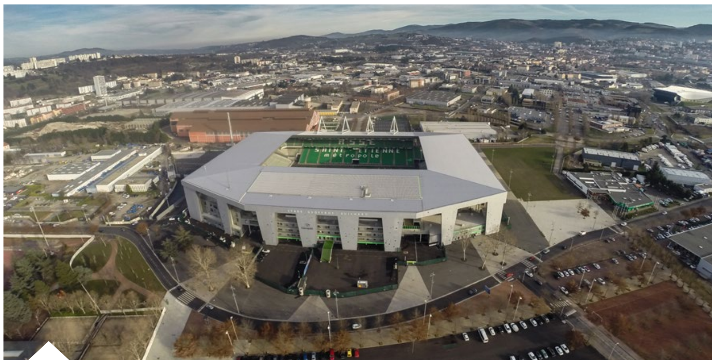
© Saint-Étienne Métropole / Fertil Ink – Stade Geoffroy Guichard. Direction de la Communication VSE – SEM.

La Métropole a en effet lancé le projet d'une salle de type aréna sur la commune de Saint-Chamond (quartier de La Varizelle). Cette salle d'une capacité de 3 800 places sera l'antre du Saint-Chamond Basket Vallée du Gier, qui évolue dans l'antichambre de l'élite du basket français (ProB). Elle permettra aussi à la Métropole de candidater pour de nouveaux grands événements sportifs dans d'autres disciplines telles que le handball, le volleyball, le basket ou encore le tennis.