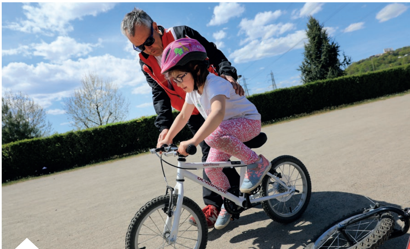
École municipale des sports baby vélo.

Chaque année, 100 classes et 2 800 enfants de Saint-Étienne suivent des ateliers vélo dans le cadre de l'école municipale des sports. Ils sont encadrés par des éducateurs municipaux qui interviennent en appui des enseignants. Saint-Étienne propose aussi des séances en extrascolaire les mercredis et durant les vacances scolaires.